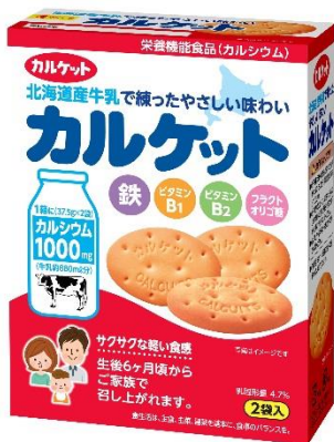
栄養機能食品(カルシウム)

※栄養機能食品:保健機能食品の一種。高齢化や食生活の乱れなどで不足しがちな栄養成分の補給・補完のために利用する食品。