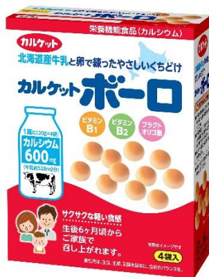
栄養機能食品(カルシウム)

商品名(JANコード・内容量): カルケット JANコード: 4571155820714 内容量: 75g(37.5g×2袋入) カルケットポーロ JANコード: 4571155820868 内容量: 80g(20g×4袋入) 希望小売価格: NPP 発売日: 2017年3月6日 発売地区: 全国