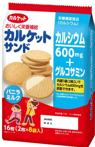
栄養機能食品(カルシウム)

商品名(JANコード・内容量): カルケットサンド ごま JANコード:4571155821131 カルケットサンド バニラミルク JANコード:4571155822367 内容量:16枚 希望小売価格:NPP 発売日:2017年3月6日 発売地区:全国